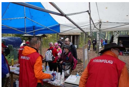
Pilkuttimen huoltopisteellä 2019