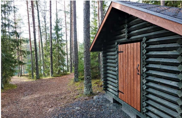
Ilvesreitiltä, Kaitalammin taukopaikalta