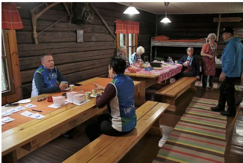
Tärkeä aamupalaveri sisällä Kalamajalla ja ulkona P-paikalla.