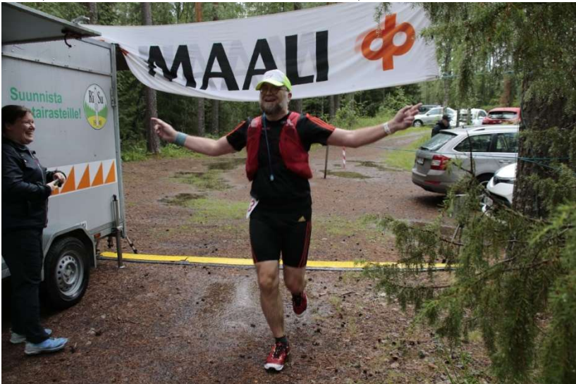
Iloiset ilmeet lähdössä ja maalissa!