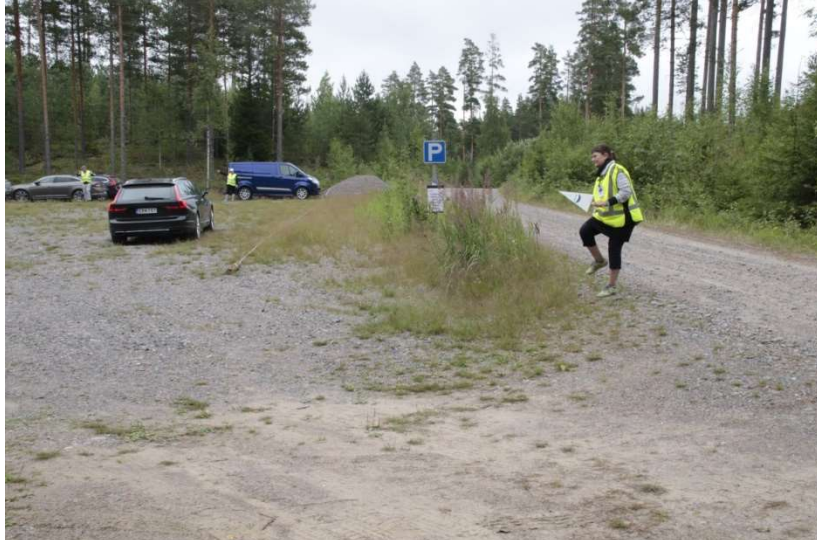
Mitenkähän saisimme autot sopimaan...?