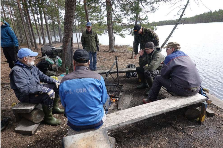
Pitkospuutalkoiden tauolla Luutalammilla